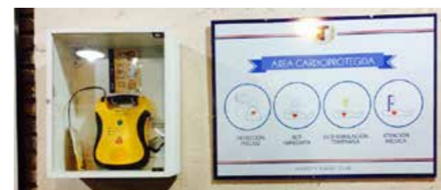
Ubicado en la Cantina de nuestro Club.

Desde el equipo Salud y Deporte se trabaja intensamente en este tema, y eso llevo a que Marista sea el primer Club de Mendoza en adquirir un Desfibrilador Externo Automático (DEA). Además, se brindan talleres para capacitar en técnicas de Reanimación Cardio-Pulmonar (RCP). Esto es un avance hacia la prevención de la muerte súbita y la atención temprana ante emergencias, acción que puede realizar cualquier persona capacitada y que es clave para salvar vidas.