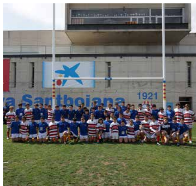
1º partido de la gira contra UNION SPORTIVA STAMBOIANA